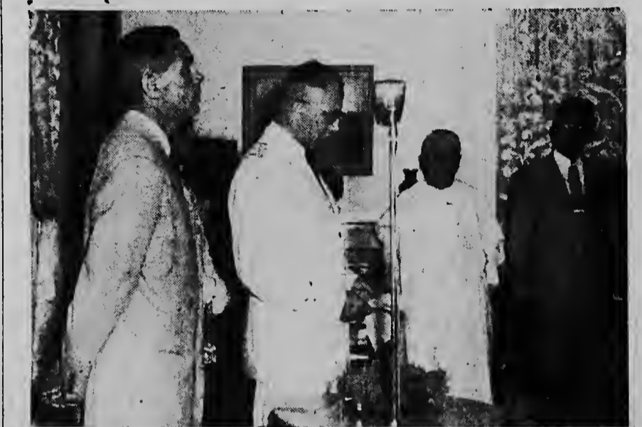
Z.E. de Gouverneur tijdens het uitspreken van zijn rede bij het Openbaar Gehoor.